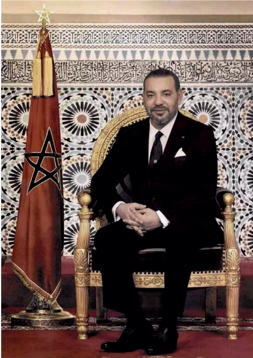
Sa Majesté Le Roi Mohammed VI, que Dieu Le glorifie